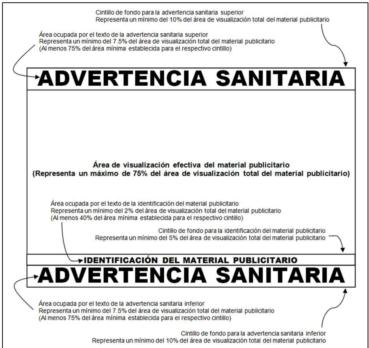
Figura 2. Normas sanitarias para materiales dinámicos.

La figura 2 ilustra lo requerido por esta norma sanitaria, para el caso general de un material publicitario cuya área de visualización corresponda, en su geometría, a un paralelogramo rectángulo: